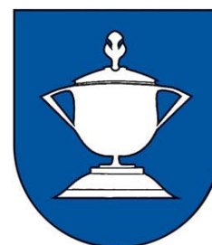
Obrázok 2 Erb obce

Erb obce Hermanovce nad Topľou tvorí v modrom štíte zdobenou pokrievkou prikrýty dvojuchý kalich na krátkej stopke, všetko strieborné.