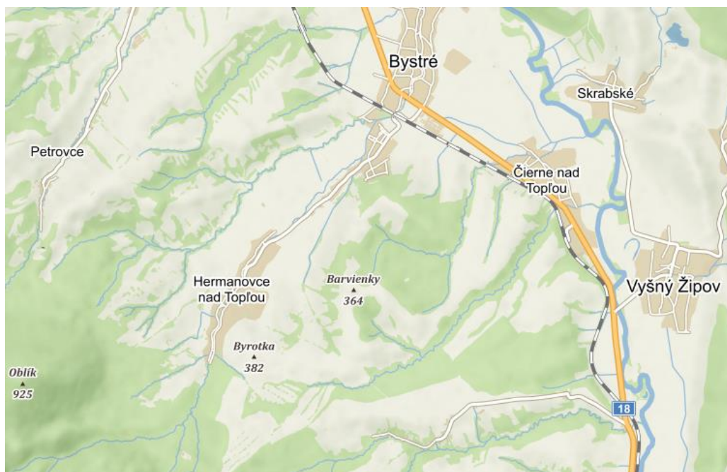
Obrázok 1 Mapa polohy obce

Hermanovce nad Topľou ležia na severovýchodných svahoch Slanských vrchov v doline Hermanovského potoka. Nadmorská výška v chotári obce je 240 – 1 092 m n. m.