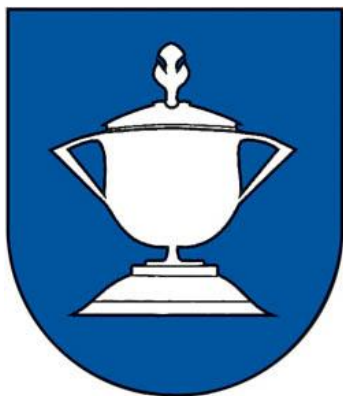
Príloha 1: erb obce